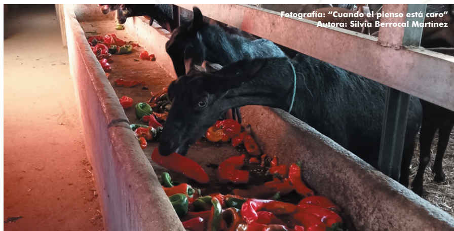
Fotografía: "Cuando el pienso está caro"

- Los sectores ganaderos españoles han hecho ya un gran esfuerzo en reducción de medicamentos siendo referente a nivel europeo, siendo importante mostrarlo a la opinión pública para mejorar la imagen del sector.