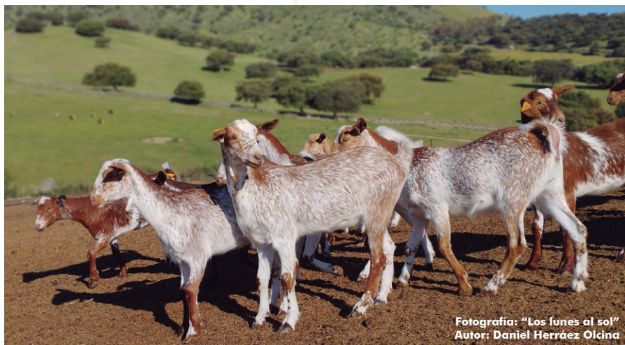
Fotografía: "Los lunes al sol" Autor: Daniel Herráez Olcina