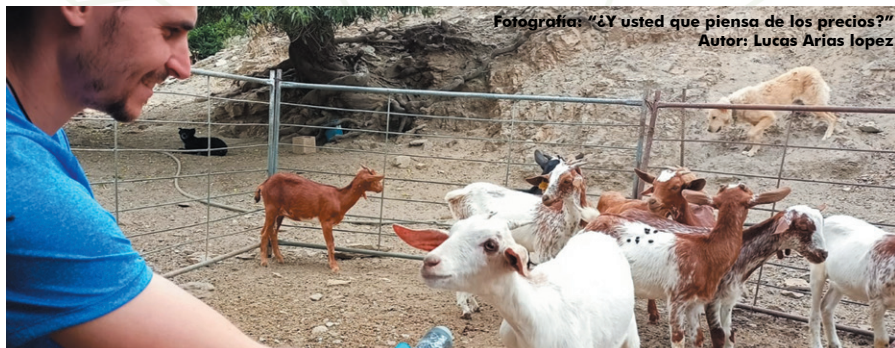
Fotografía: "¿Y usted que piensa de los precios?" Autor: Lucas Arias Lopez